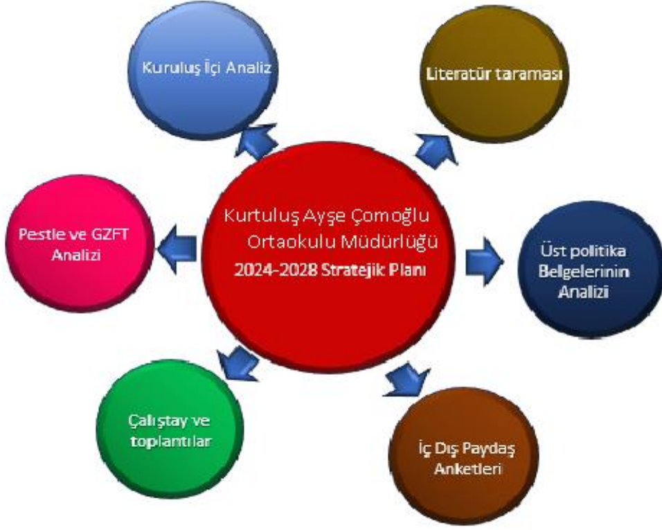
Şekil 1: Stratejik Plan Süreci